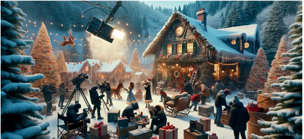
Imagem: David P.